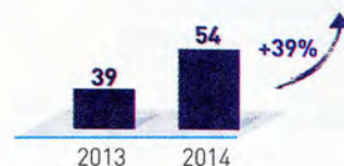
Résultat Net Récurrent en MDH

* hors éléments non courants et écritures propres à l'IFRS