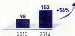
Excédent Brut d'Exploitation en MDH